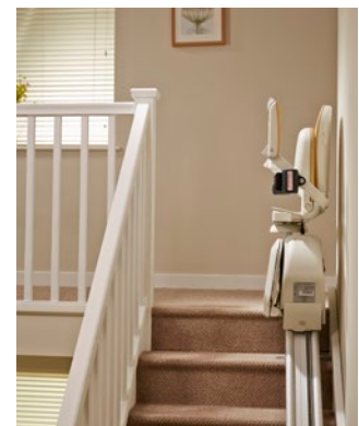
Haltestelle oben – Sitz hochgeklappt – die Treppe ist frei