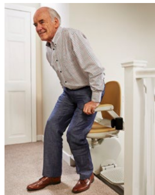
Haltestelle oben – Sitz auf Podest gedreht für sicheren Ein- und Ausstieg