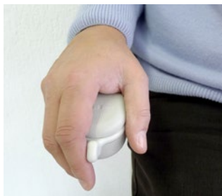
Benutzerfreundlicher Fahrbefehl in beiden Armlehnen