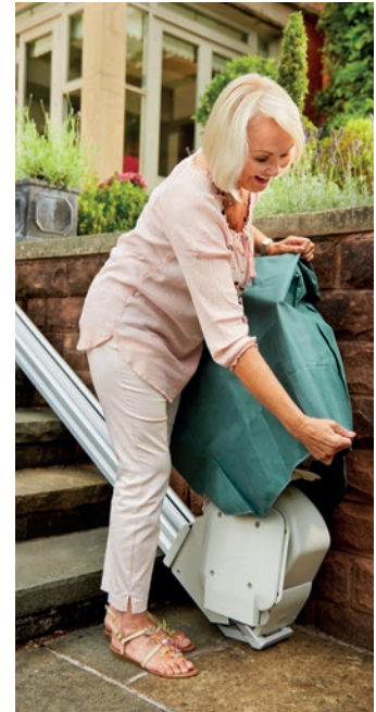
Treppenlift mit Abdeckung